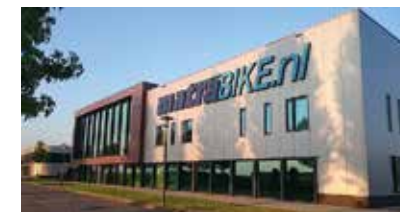
Matrabike Experience Center Waalwijk (NL)

matrabike AL 30 JAAR VAN FABRIKANT NAAR KLANT!